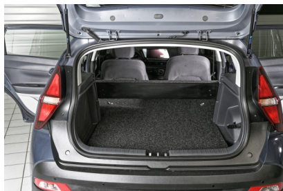
Kit VU seul