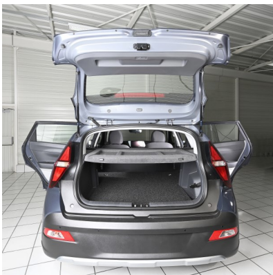
Kit VU avec couvre bagage