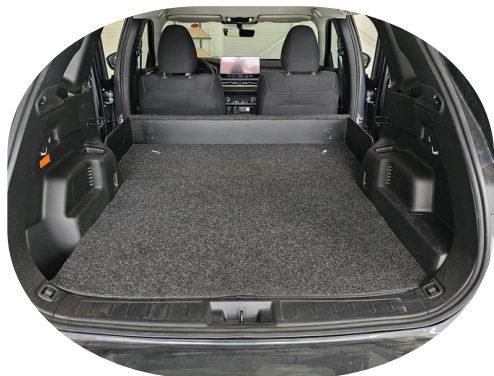
Kit société seul