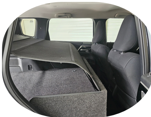
Kit société avec couvre bagage