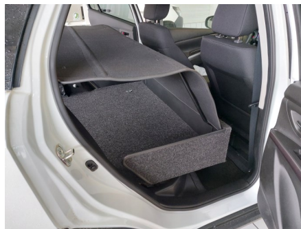
Kit VU avec couvre bagage