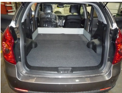
Kit VU seul New Korando