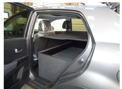
Kit VU New Korando avec couvre bagage