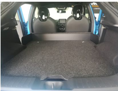
Kit VU seul