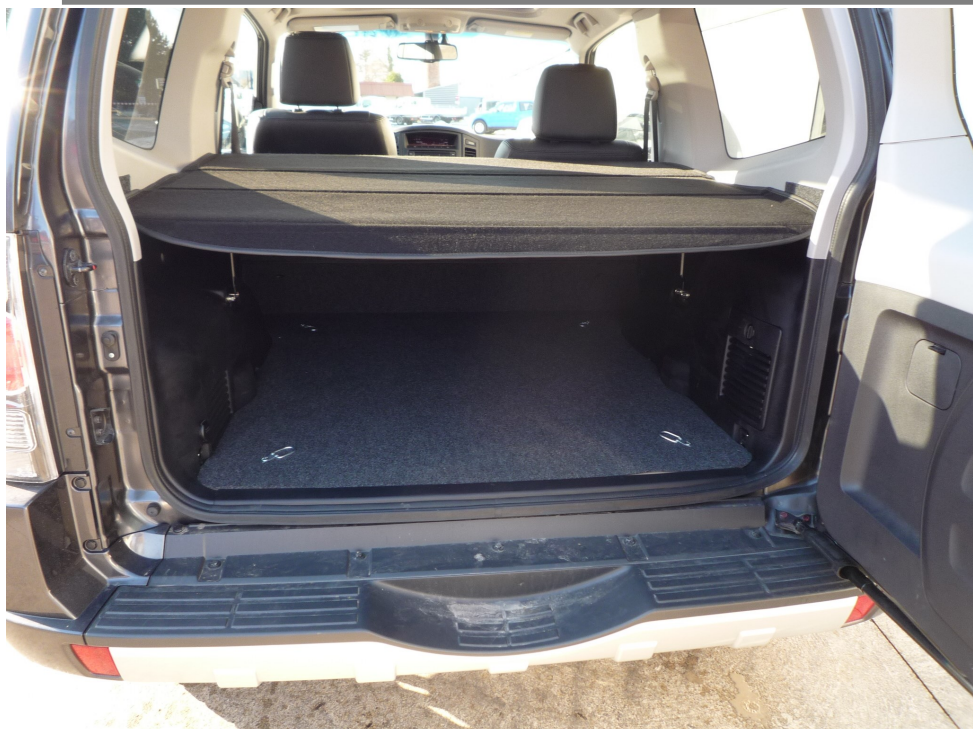
PAJERO COURT 3 PORTES

MITSUBISHI PAJERO 3 PORTES UNIQUEMENT OPTION COUVRE BAGAGES MODELE 2013 REF:13-MPC1-CB 1001