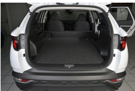
Kit VU seul