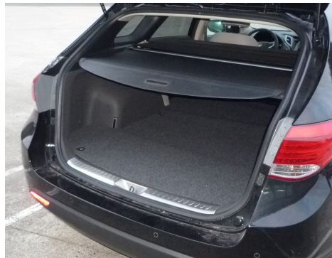
Kit VU seul avec couvre- bagage