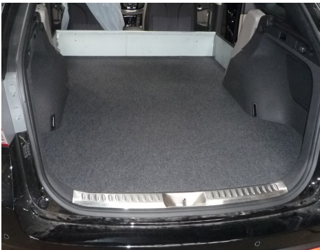
Kit VU seul