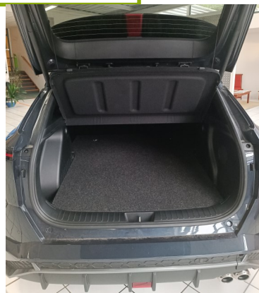
Kit VU seul