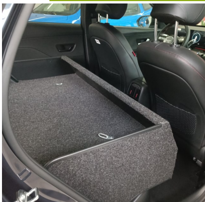
Kit VU seul