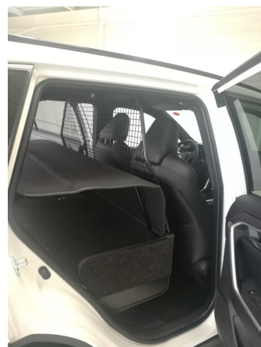
Kit avec couvre bagage + grille