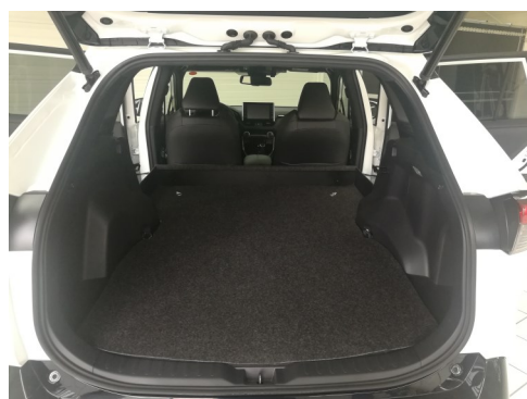
Kit VU seul