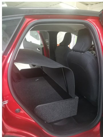
Kit VU avec couvre bagage