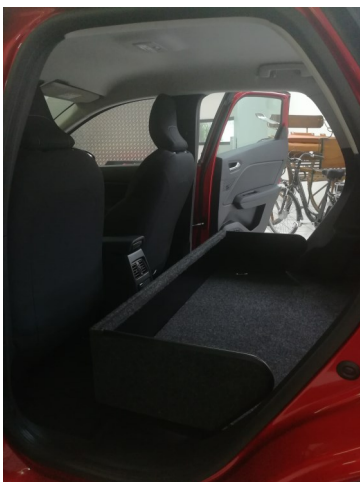
Kit VU seul