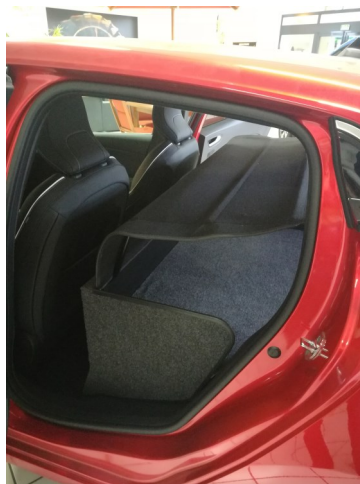
Kit VU avec couvre bagage