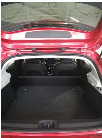
Kit VU seul