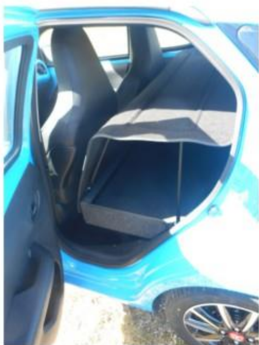
Vue de l'arrière du véhicule