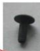
Vis poelier M6