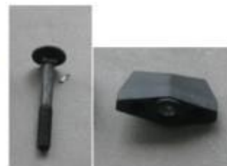
Vis JAPY M5 QTE : 2